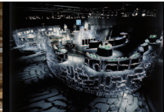
脳! 内なる不思議の世界へ展 2006