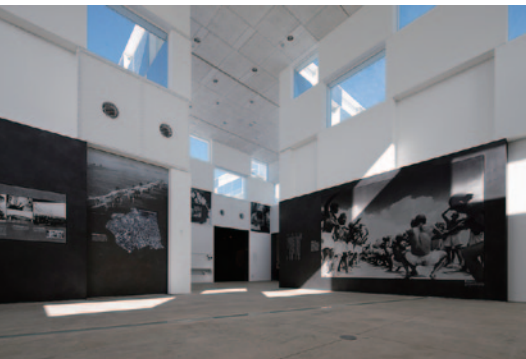
予科練平和記念館

1983年、トヨタ車体株式会社入社。 ボデー設計部で主に乗用車のアップバーボデーの設計に携わる。1993年、産業技術記念館建設準備事務局に出入りし、開館に向けた展示の準備を行う。開館後も引き続き、自動車館の展示企画や特別展などのイベントを担当。開館準備から10周年、15周年、20周年のリニューアル全てに関わってきた唯一の事務局スタッフ。 現在は自動車館グループ・グループリーダーを務める。