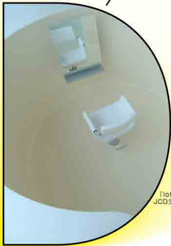
「lotus beauty sa on」 / 中村拓志 JCDデザインアワード2006大賞