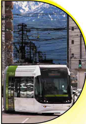
第40回SDA賞 大賞 経済産業大臣賞 富山ライトレール 富山港線トータルデザイン / 富沢 功

(社)日本ディスプレイデザイン協会[DDA]、(社)日本商環境設計家協会[JCD]、(社)日本サインデザイン協会[SDA]の主催で、過去1年間に制作された美術館・博物館・商業施設・アミューズメントパーク・展示会等の優秀なものを顕彰。広く空間デザインを網羅する最新のデザイン動向が見られます。