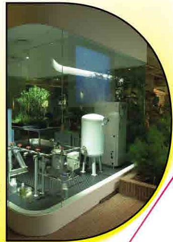
大手町カフェ / 鈴木恵千代 ディスプレイデザイン賞2006大賞・朝日新聞社賞